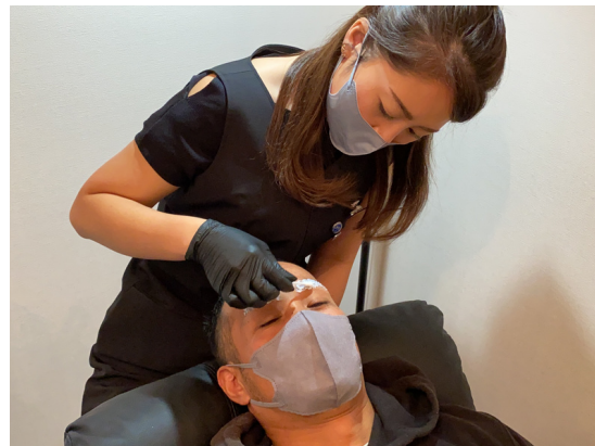
初めての方も安心！丁寧な説明と施術