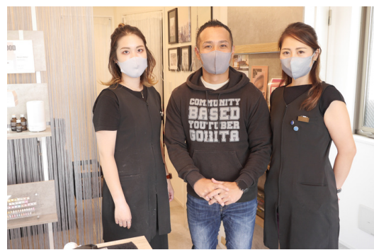
素敵なスタッフがお出迎え

ワックスで処理して完成… カウンセリング通り【清潔感と優しさのあるスッキリ眉】になりました。 正直、眉毛だけでこんなに印象が変わるとは驚き！ プロの技術はすごいです！取材に同行し、ゴリ田の変身ぶりを目の当たりにした女性スタッフは、さっそくHBLとジェルネイルを予約していました。 成増駅からも徒歩3.4分と好アクセスなので、お仕事帰りやランチがてら是非行ってみてくださいね。