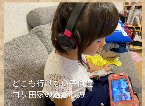
どこも行けない子供達 ゴリ田家の過ごし方

【東京五輪】 話題は変わりますが、東京五輪は皆さん見ましたか？ オリンピックの開催の有無については賛否両論あると思いますが、僕はやはりスポーツの力は凄いと改めて感じました。 日本人の活躍は凄まじく、どの競技も熱く盛り上がりました。 こんなにテレビに釘付けになったのは最近なかったように思います。 それぐらい人を魅了し、感動させスポーツの力はコロナをも吹き飛ばす・・・。 そうとはなりませんでしたが、見てる人に感動を与えたのは間違いありません。 少なくとも僕はその一人です。感動をありがとう！