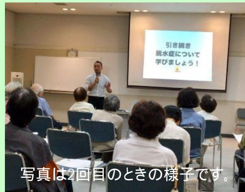
写真は2回目のときの様子です。